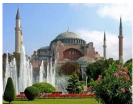
St Sophia Kerk